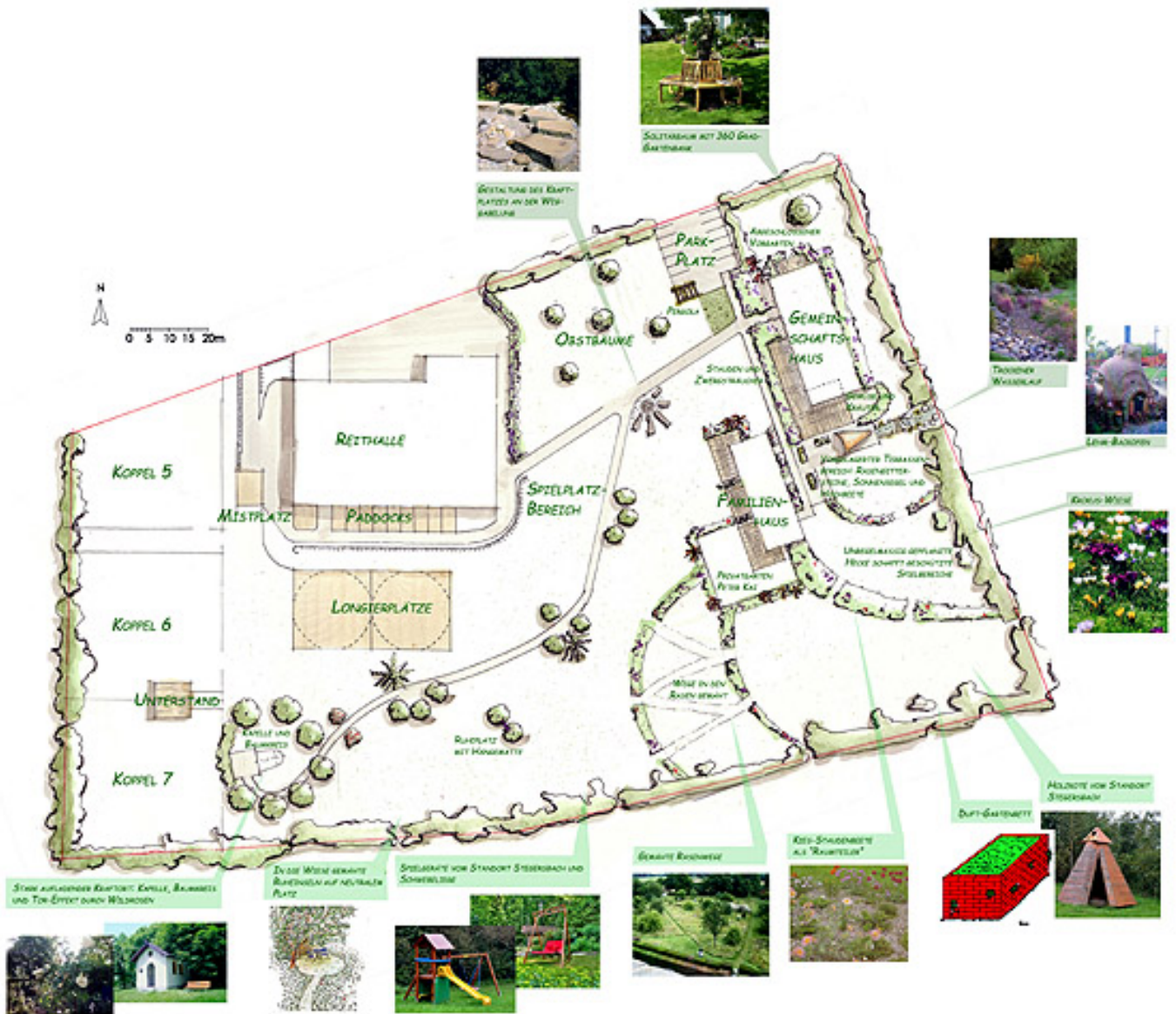
Übersichtsplan des Gartens

Montag, 28. Juni 2010 um 10:58 Uhr - Aktualisiert Mittwoch, 08. September 2010 um 09:56 Uhr